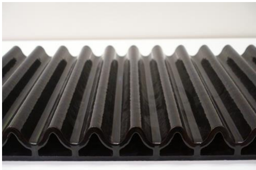
03_MPestalozzi_Keramik (5472x3648 Pixel)