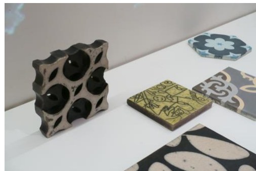
02_MPestalozzi_Keramik (5472x3648 Pixel)