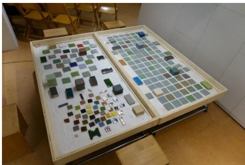
01_MPestalozzi_Keramik (5472x3648 Pixel)

Die folgenden Aufnahmen stehen bei Interesse in hoher Auflösung zur Verfügung. Download: http://bau-auslese.ch/Keramik.zip